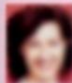
Flirt-Profis Flirt-Profis sind Menschen, die sich nicht scheuen, sich mit anderen zu unterhalten. Sie sind offen und entspannt, sprechen zu den Menschen, die sie ansprechen wollen. Sie sind auch in der Lage, sich selbst zu unterhalten. Sie sind auch in der Lage, sich selbst zu unterhalten.

Nehmen Sie sich und die Situation nicht zu ernst. Verzichten Sie auf auswendig gelernte Sprüche. Gehen Sie lieber charmant auf die Situation ein, sagen Sie etwa: „Ihr Haar hat den selben Farbton wie das Herbstlaub.“ Eine freche Unterstellung („Sie können wahrscheinlich nicht besonders gut einparken“) garniert mit einem Lächeln wirkt hinreißend.